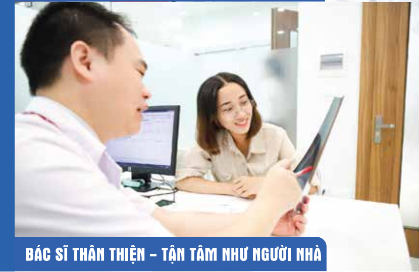
BÁC SĨ THÂN THIỆN – TẬN TÂM NHƯ NGƯỜI NHÀ