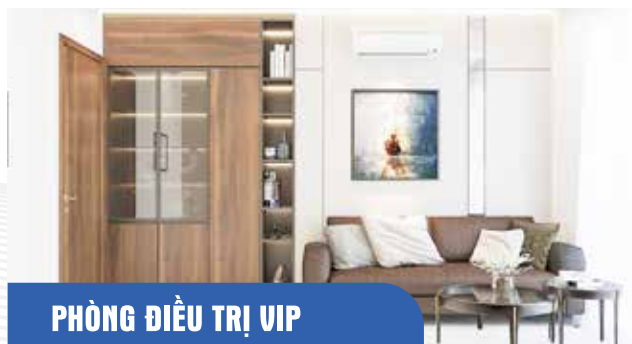
PHÒNG ĐIỀU TRỊ VIP