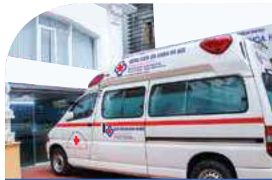
Xe cấp cứu

Phòng Cấp cứu của bệnh viện có đầy đủ các trang thiết bị hiện đại, phục vụ tốt nhất cho các ca điều trị khẩn cấp cho bệnh nhân: