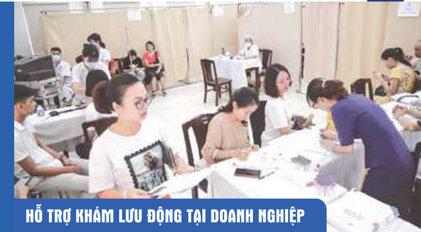
HỖ TRỢ KHÁM LƯU ĐỘNG TẠI DOANH NGHIỆP

Bệnh viện cung cấp rất nhiều gói khám sức khỏe khác nhau, phù hợp với từng độ tuổi, giới tính, đặc thù nghề nghiệp với các dịch vụ khám cơ bản và nâng cao.