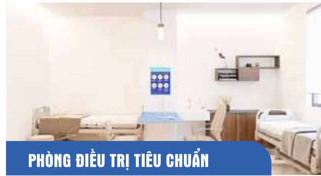
PHÒNG ĐIỀU TRỊ TIÊU CHUẨN