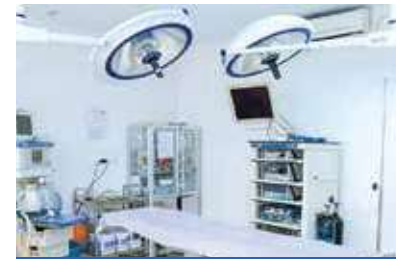
Thiết bị hồi sức cấp cứu

Xe cấp cứu trang bị toàn diện phục vụ 24/24h