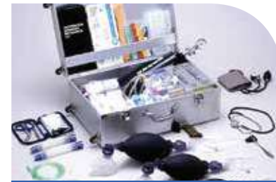
Dịch vụ hỗ trợ tại chỗ