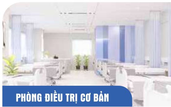
PHÒNG ĐIỀU TRỊ CƠ BẢN

Phòng Standard là phòng điều trị nội trú được bố trí theo mô hình phòng nghỉ riêng biệt đạt tiêu chuẩn phòng bệnh quốc tế với chi phí hợp lý, đa dạng phù hợp với nhiều đối tượng khách hàng khác nhau.