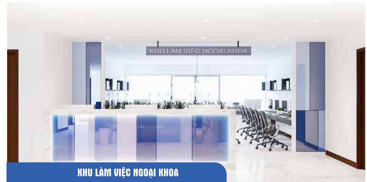
KHU LÀM VIỆC NGOẠI KHOA