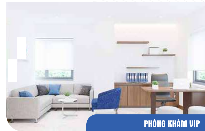
PHÒNG KHÁM VIP