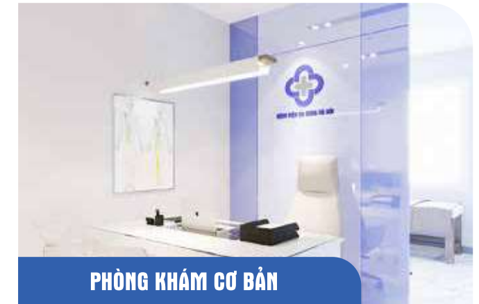
PHÒNG KHÁM CƠ BẢN

Các phòng khám đều được thiết kế hiện đại, tiện lợi và phù hợp với yêu cầu khám chữa bệnh của bác sĩ