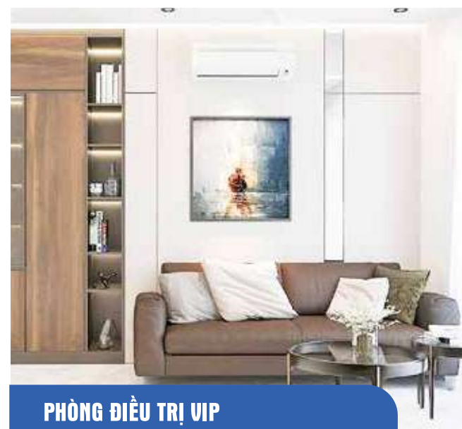
PHÒNG ĐIỀU TRỊ VIP

Tại Bệnh viện Đa khoa Hà Nội bệnh nhân và người nhà bệnh nhân sẽ nhận được sự chăm sóc tận tâm, chuyên nghiệp của nhân viên y tế; đảm bảo môi trường xanh, sạch, đẹp giúp bệnh nhân cảm thấy vui tương, yêu đời hơn ngay cả khi đang mệt mỏi.