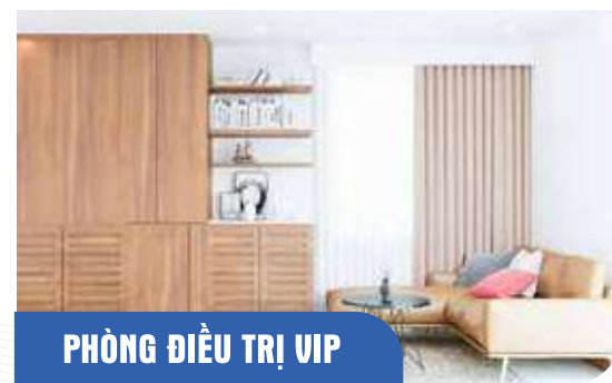
PHÒNG ĐIỀU TRỊ VIP