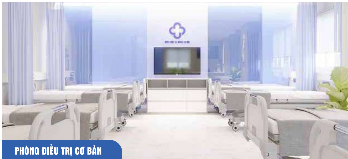
PHÒNG ĐIỀU TRỊ CƠ BẢN